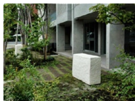
尹熙倉 (ゆんひちゃん) アーティスト 多摩美術大学工芸学科准教授。陶による立体、陶粉画