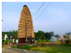
曾我部昌史 (そがべまさし) 建築家 神奈川大学工学部建築学科教授。みかんぐみ共同主宰